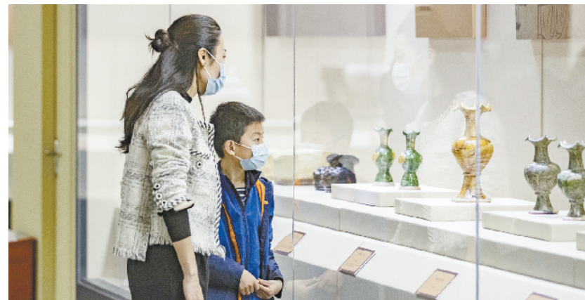
三峡博物馆举办“西京印迹——大同辽金元文物展” 4月17日,观众在“西京印迹——大同辽金元文物展”上参观。近日,“西京印迹——大同辽金元文物展”在重庆中国三峡博物馆开展。展览由重庆中国三峡博物馆和大同市博物馆共同主办,以民族融合为主题,展出辽金元时期铜器、金银器、陶瓷、家具、壁画等140余件(套)珍贵文物,向观众展现了辽金元时期器物制作的工艺水准,和那一时期民族交融下独特的民俗。

新华社北京4月17日电(记者李恒)国家卫生健康委、民政部等五部门近日联合印发《关于开展2022年宣传周活动的通知》。通知要求有效落实“防、治、管、教、建”五字策略,强化党委政府、部门、用人单位和劳动者个人四方责任,进一步增强全社会职业健康意识,有效提高劳动者健康水平。