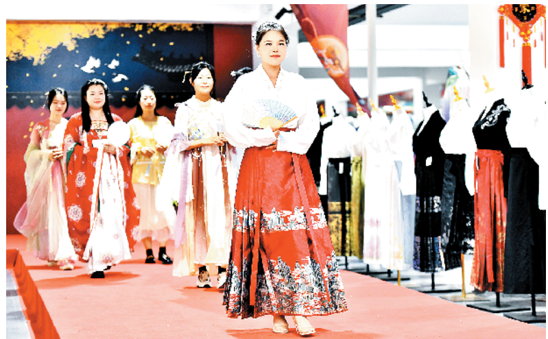
山东曹县:聚力发展汉服产业 助力乡村振兴

7月6日,在曹县安蔡楼镇有爱云仓汉服基地,女主播们身着汉服走秀。山东省曹县依托电商资源优势,聚力发展汉服产业,形成了从印染、剪裁、绣花、打版、成衣全产业链条。今年1-6月,曹县汉服营销收入近40亿元,汉服产业不仅成为当地群众增收、乡村振兴的新引擎,还吸引了近两万名大学生返乡就业、创业。