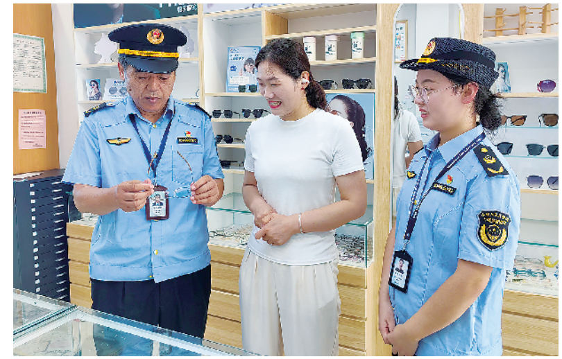
连日来,周口市市场监管局港区分局加大眼镜配制计量器具检验检测工作力度,并开展计量诚信公示承诺活动。图为8月19日,该局市场监管人员在一家眼镜店进行检查。