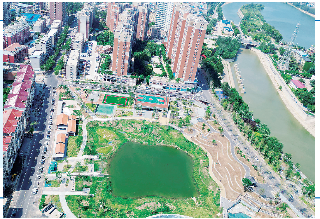
近日,位于中心城区周口南寨历史文化街区西大街西段的西大坑公园,以靓丽的形象展现在广大市民面前。经过两年建设,昔日的废旧坑塘,如今变成了美丽公园。图为鸟瞰西大坑公园。