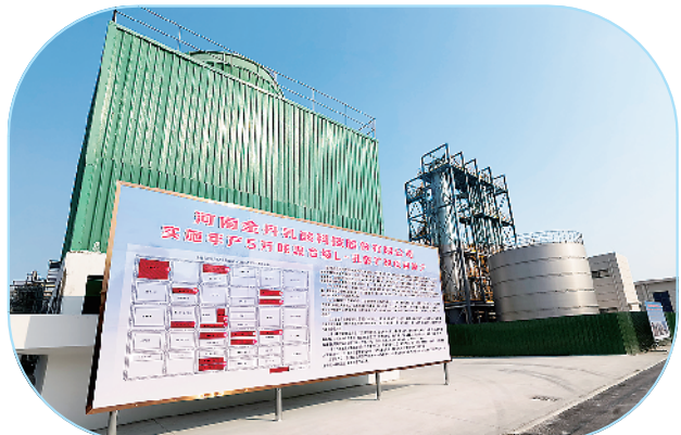
河南金丹乳酸科技股份有限公司年产5万吨聚合级L-乳酸扩改项目。

该项目总投资1.3亿元,总建筑面积2万平方米,主要建设厂房、办公楼、研发中心、原料及成品仓库等,新购置7条固体颗粒饮料全自动智能化生产线。目前,该项目车间主体、消防池、原料仓库基础、实验中心立柱已建设完成。项目投产达效后,预计实现年产值2.5亿元、年利税2500万元,提供就业岗位100个以上。