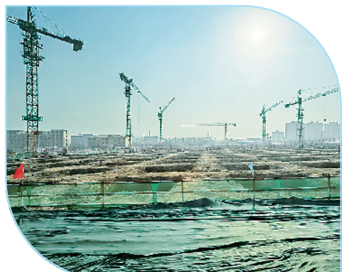
鹿邑县澄明食品产业园及配套基础设施建设项目。