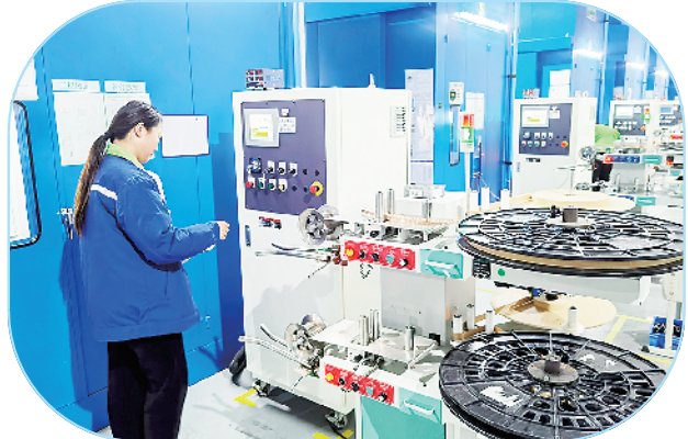
河南凯旺电子科技股份有限公司年产3500万套电子精密连接器及模具产品高端化设备改造项目。