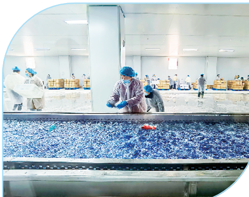
魔莱仕年产24000吨魔芋生产加工生产线建设项目。