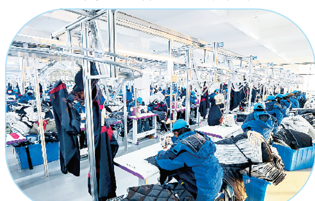
周口华亿服饰年产1500万件服饰项目。

该项目总投资约2.5亿元,占地70亩,总建筑面积6万平方米,主要建设染纱车间、织造车间、后整理车间、物料及成品仓库等,可年产25000吨化纤布面料。目前,该项目已建成投产,预计实现年产值3亿元、年利税2800万元,提供就业岗位120个以上。