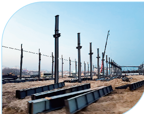
扶沟嘉乐华年产10万套成品汽车内饰及装饰材料生产项目。