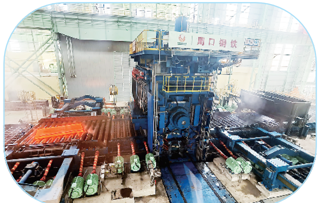
河南安钢周口钢铁有限责任公司周口钢铁宽厚板生产建设项目。

12月25日,全市2024年四季度“三个一批”重大项目建设现场督导活动继续进行。当天,督导组到沈丘县、郸城县、鹿邑县、太康县、扶沟县的主导产业项目建设现场和企业车间进行实地督导。从督导情况看,各地围绕重点产业链,以重大项目建设为抓手,助力产业提质升级,推进产业强链补链延链,一批科技含量高、市场潜力大、带动能力强的项目拔地而起,产业链条得到深度拓展,产业结构不断优化。