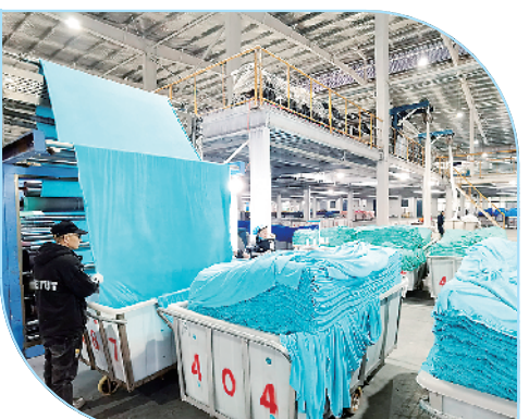
苏友年产25000吨化纤布面料印染项目。

平方米,其中包括为企业提供免费标准化新型厂房租赁面积8.38万平方米,规划建设研发、投资、办公、生产、仓储、住宿、餐厅等功能设施。目前,该项目地基基础圈梁已浇筑完成。项目投产达效后,年产值将达6亿元,年利税达6000万元,提供就业岗位1200个。