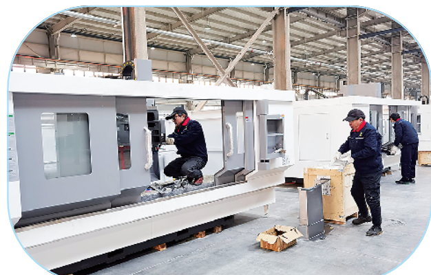
扶沟县冠城年产10万台新能源发动机缸盖缸体机底座件建设项目。

该项目总投资3.6亿元,总建筑面积10万平方米,主要建设厂房、研发楼、办公楼等,可年产10万套成品汽车内饰及装饰材料。目前,该项目正在架设厂房钢结构。项目投产达效后,可实现年产值10亿元、年利税8500万元,提供就业岗位220个以上。