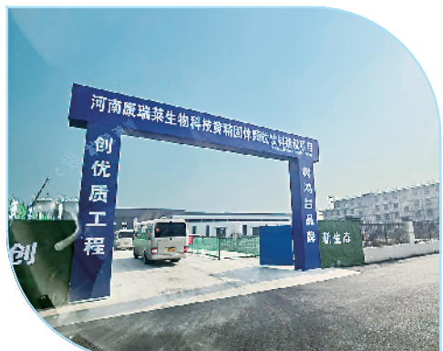
河南康瑞莱生物科技有限公司黄精固体颗粒饮料生产建设项目。