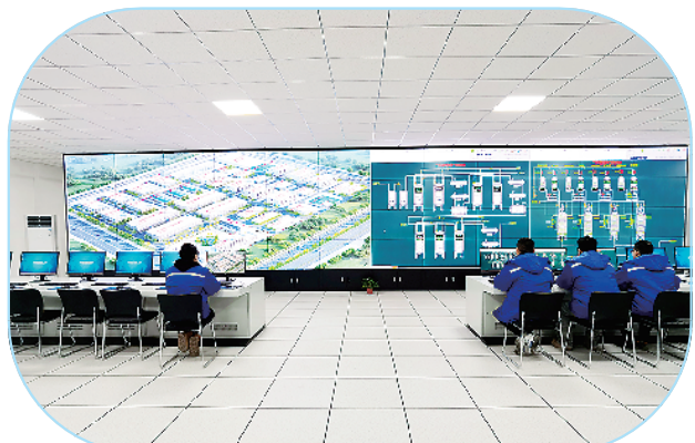
河南永润天泽科技有限公司年产2.97万吨医药中间体建设项目。