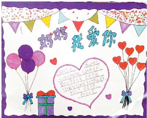
小记者:田亚东 周口临港开发区开元路小学四(2)班 (辅导老师:李娜)