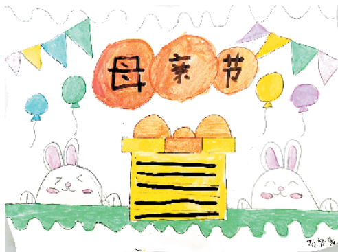
小记者:刘梦萱 周口临港开发区开元路小学三(1)班 (辅导老师:王盼盼)