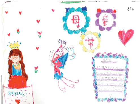
小记者:康筱米 周口临港开发区开元路小学三(1)班 (辅导老师:王盼盼)