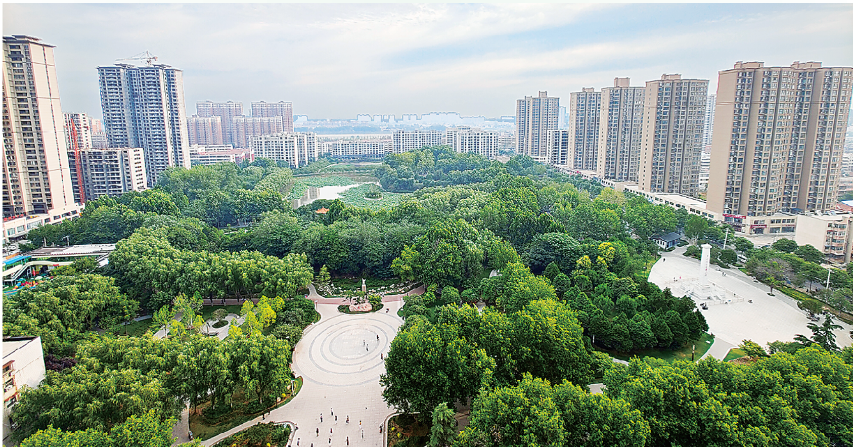
周口人民公园鸟瞰图。